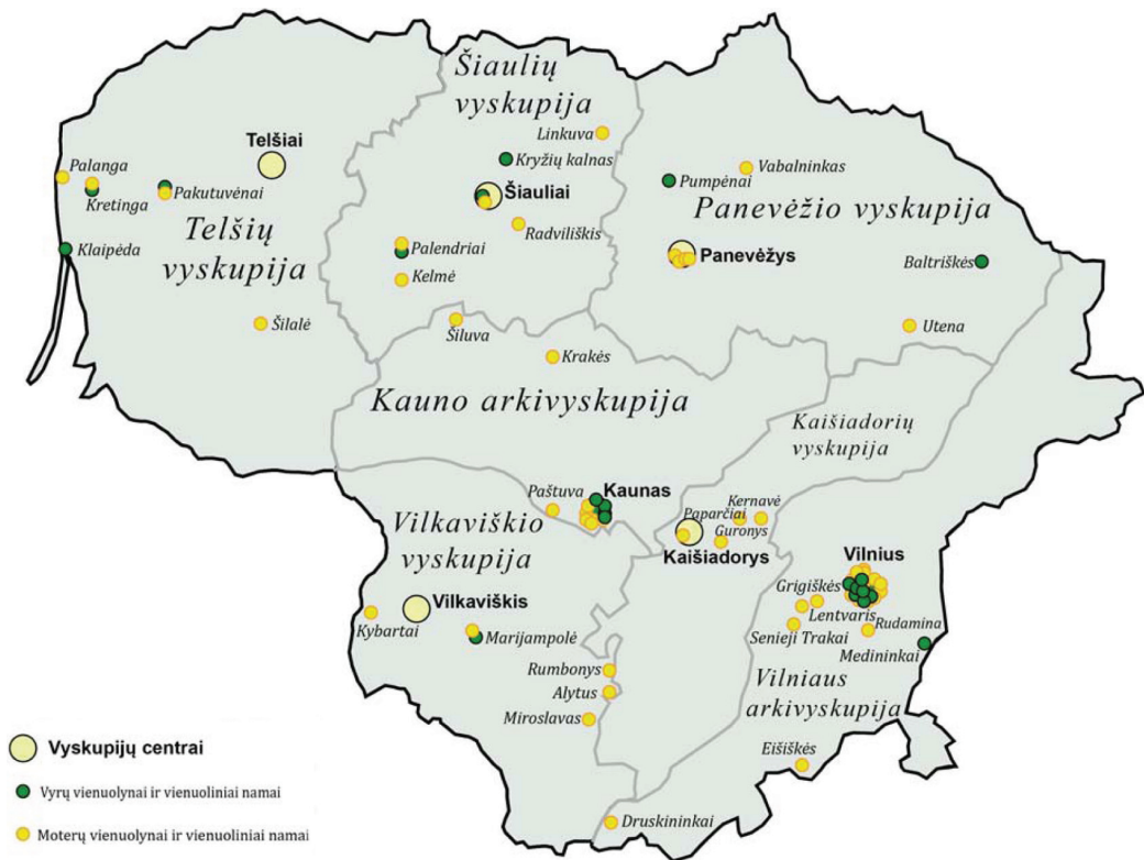
1 pav. Vyrų ir moterų vienuolynų vietos Lietuvoje