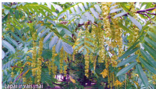
Lapai ir vaisynai

Kaukazinė pterokarija ( Pterocarya fraxinifolia ), geriausiai žinoma genties rūšis, yra gana sparčiai augantis medis trumpu ir storu kamieniu bei plačiu, apvaliu vainiku, neišsistiebiantis daugiau kaip 30 m į aukštį. Žievė pilka, matinė, išilgai rievėta. Pterokarijų šakelės ir ūgliai turi ertmėtą, į atskiras kameras pasidalijusią šerdį, kaip ir jų giminaičiai riešutmedžiai. Įdomi savybė ta, kad jų pumpurai neturi apsauginių žvynelių ir formuojasi ne lapų pažastyse, o šakelių viduryje, ant trumpųjų stiebelių. Lapai iki 60 cm ilgio, sudėtiniai plunksniški, su 7–27 bekočiais lapeliais. Žiedai vienalyčiai, formuojasi skirtinguose žiedynuose. Vyriški žiedynai stori, žali, 7,5 – 12,5 cm ilgio, moteriški ilgesni, su rečiau išsidėsčiusiais žaliais žiedais, kuriuose matosi raudonos purkos. Vaisynai labai dekoratyvūs, 30–50 cm ilgio, juose bręsta maždaug 1,8 cm pločio