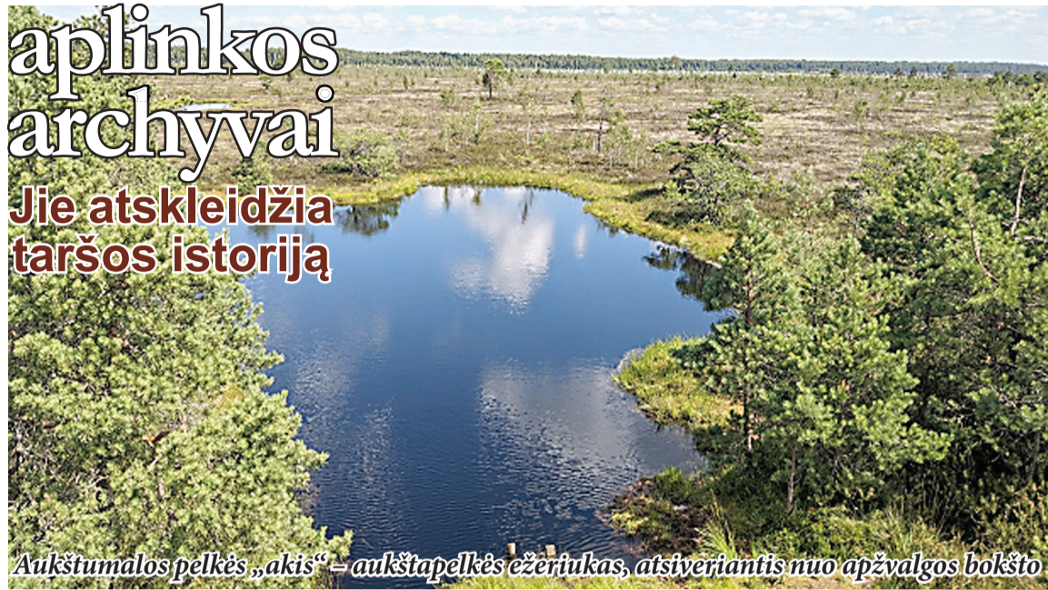
Aukštumalos pelkės „akis“ – aukštapelkės ežerukas, atsiveriantis nuo apžvalgos bokšto

Šiuos procesus Lietuvoje tyrė VMTI Gamtos tyrimų centro Geoaplinkos tyrimų laboratorijos mokslininkai. Jie vertino, kaip skirtingų tipų pelkėse kaupiasi cheminiai elementai ir ką tai gali pasakyti apie aplinkos būklę. Tyrimų metu buvo nagrinėjamos įvairios Lietuvos pelkės – aukštapelkės (Aukštumala, Kamanos,