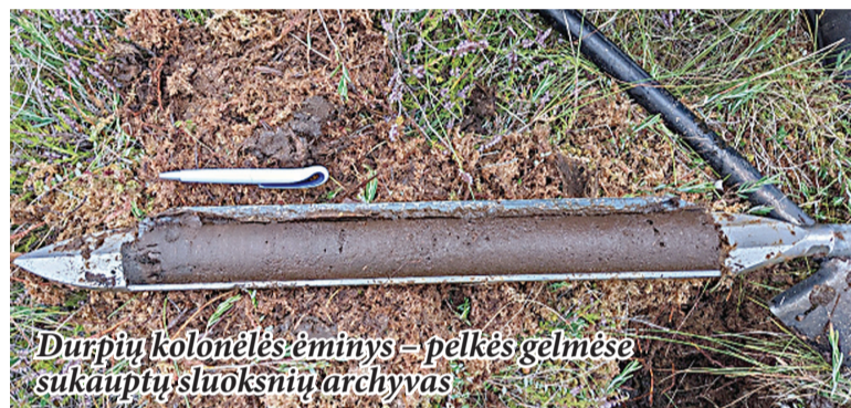
Durpių kolonėlės ėminys – pelkės gelmėse sukauptų sluoksnių archyvas

Čepkeliai), žemapelkės (Svirplinė, Baltoji Vokė) bei žmogaus paveikti, eksploatuoti durpynai. Mokslininkai lygino paviršinį durpių sluoksnį, atspindintį dabartinę aplinkos būklę ir šiuolaikinę taršą, su gilesniais sluoksniais, susiformavusiais dar prieš intensyvią žmogaus veiklą. Tai leido įvertinti, kaip laikui bėgant keitėsi medžiagų kaupimasis pelkėse.